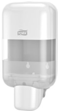
Tork Mini Soap&Sanitizer Disp.Wh 565200