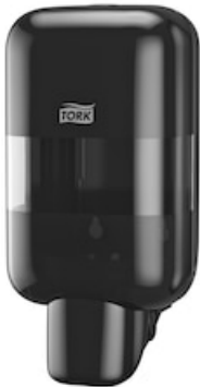
Tork Mini Soap&Sanitizer Disp.Bl 565208